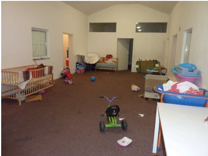
Flur Riedweg DG-Nord

Aktuell: Putzplan und regelmäßige Kontrolle in der AU Hirschen durch den Helferkreis