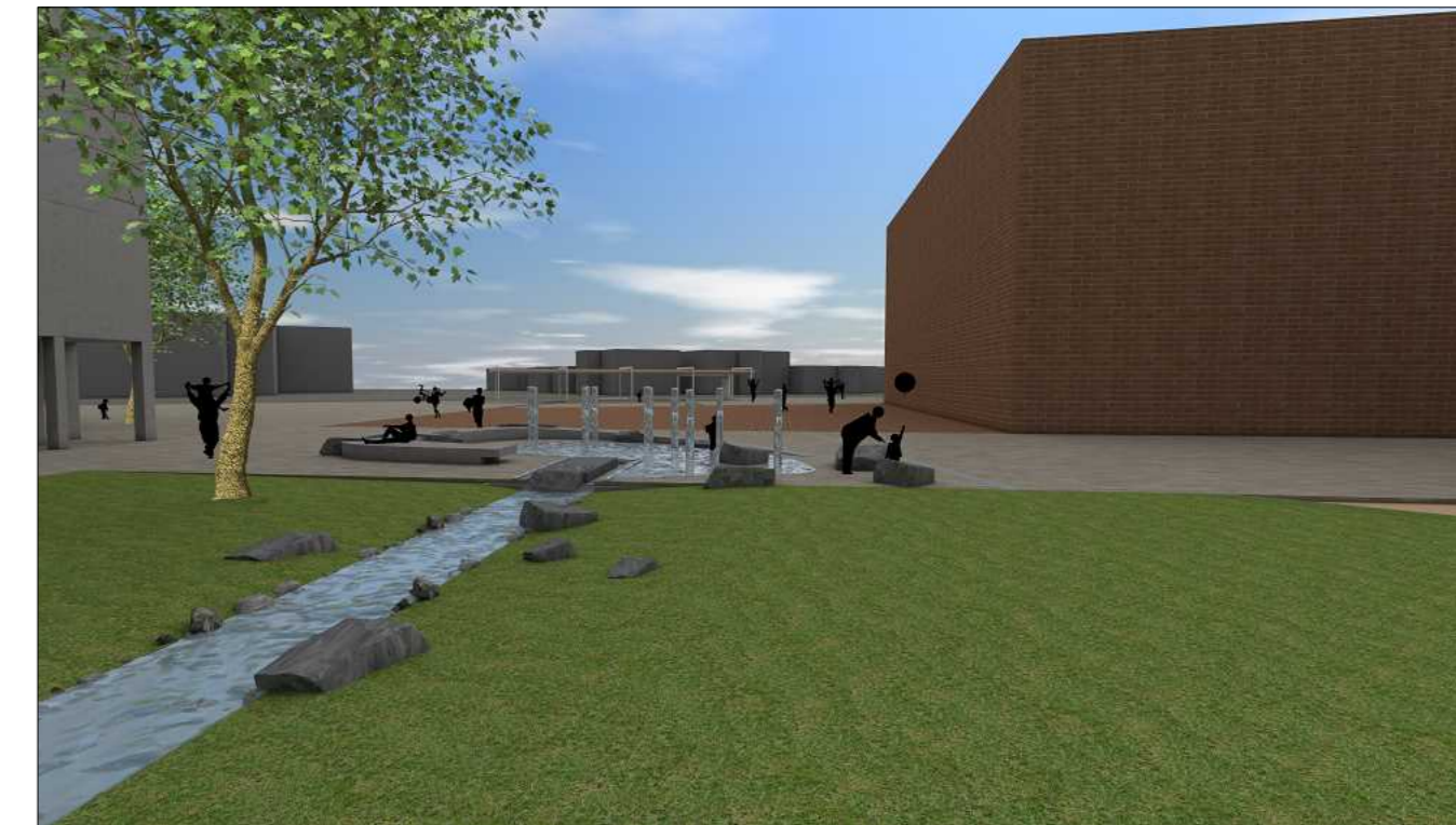
3D Ansicht von Bürgerpark