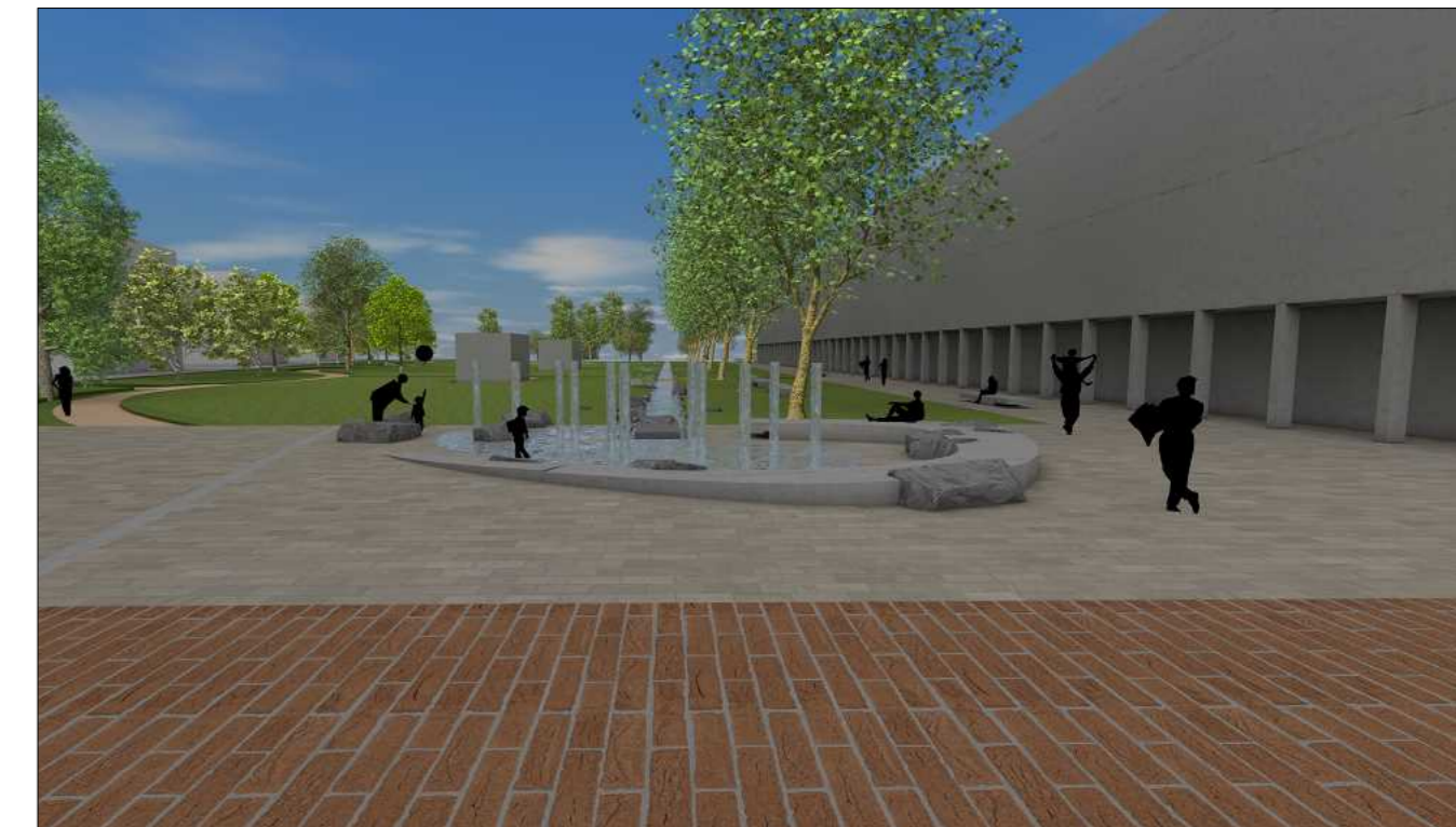
3D Ansicht von Rathausplatz