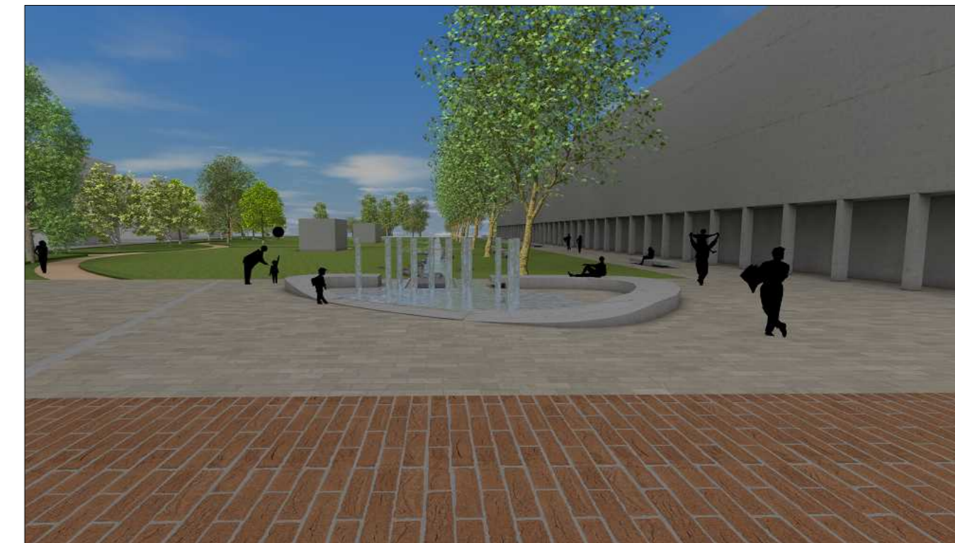
3D Ansicht von Rathausplatz