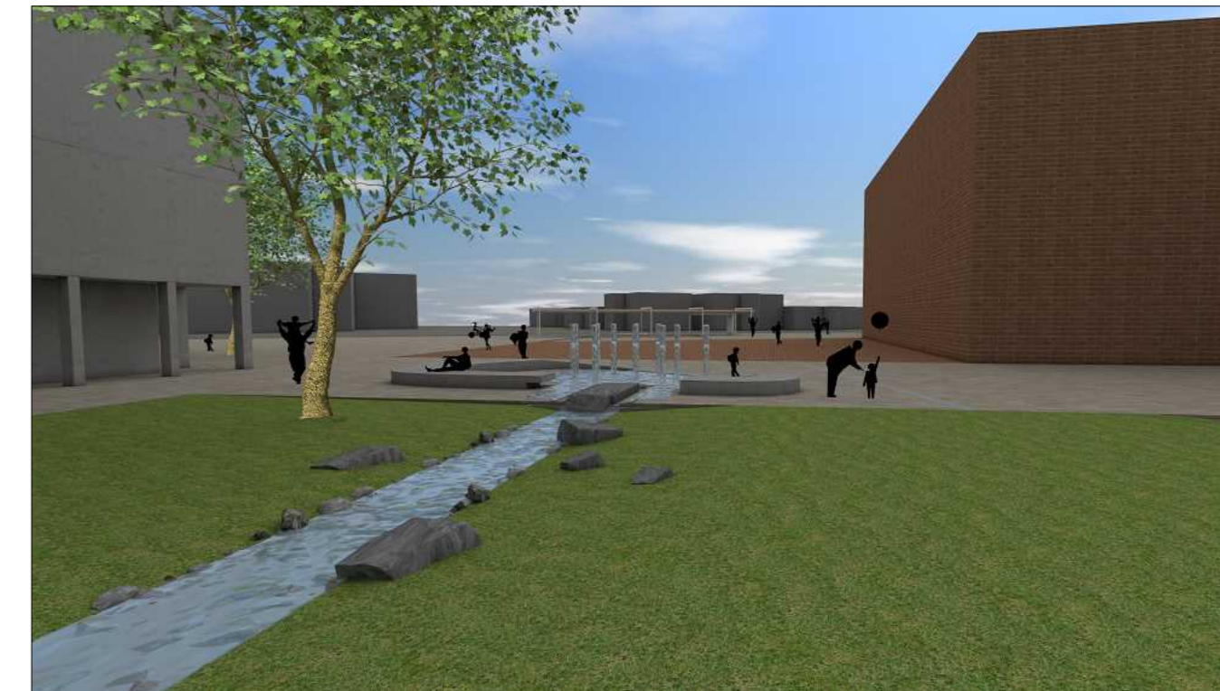
3D Ansicht von Bürgerpark