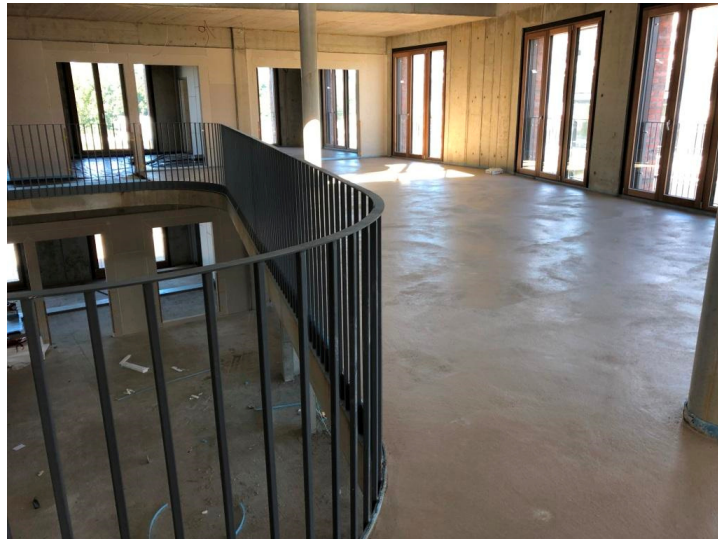
Rathaus – Estrich 2. OG