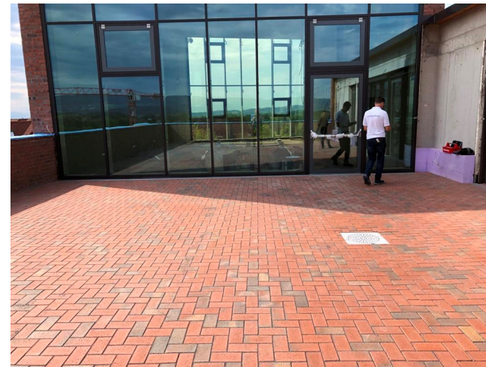
Terrassenbelag 4. OG