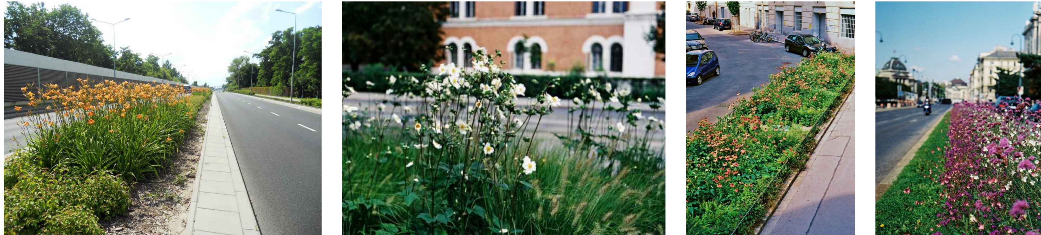
Beispiele Begrünung Mittelinsel auf Dachsubstrat (Brückenbauwerk)