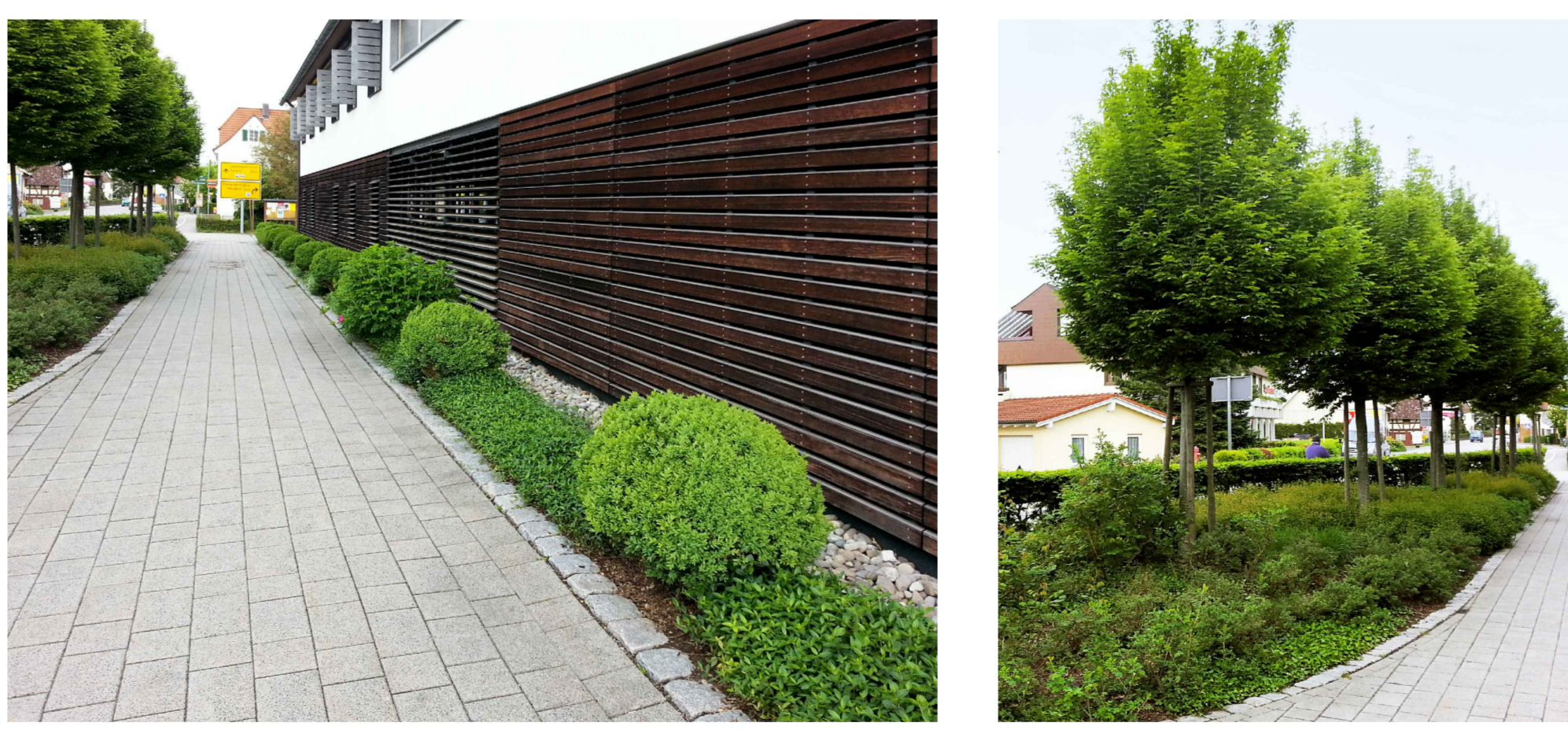
Beispiele Straßenbegleitgrün in Anlehnung an bestehendes Pflanzkonzept