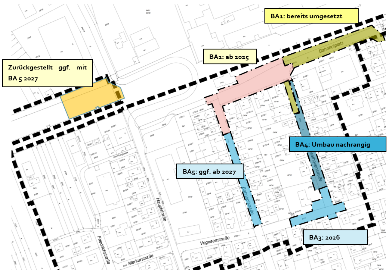
Abbildung 1-1: Bauabschnittsbildung „Am Bahnhof“

Aus finanziellen Gründen sollen die ausgeschriebenen Leistungen und die davon abhängigen Zuschüsse nochmals betrachtet werden, um ggf. eine Streichung von Teilleistungen vorzunehmen.