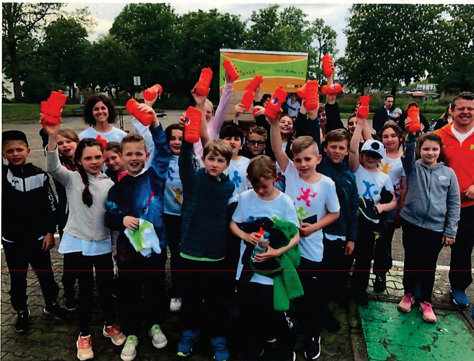
Bild 1: Die fitteste 4. Klasse 22/23 kommt aus Bischweier, hier die Siegerehrung

Mit Unterrichtsbeginn des Schuljahres 2022/23 hat die Kindersportschule in allen Partnerschulen die Klassenaufteilung im Sportunterricht aufgenommen. Zusätzlich wurde die ehemals kostenpflichtigen Kurse wie Bodyfit und Aufmerksamkeitstraining in Bewegung in einzelnen Schulen in das kostenfreie AG-Angebot überführt, um dieses Angebot niederschwellig für alle Grundschul Kinder zugänglich zu machen. Wieder im Programm war auch der Wettkampf um die fitteste 4. Klasse der KiSS Mittelbaden. Hier nahmen zum ersten Mal zehn 4. Klassen aus allen Partnergrundschulen teil.